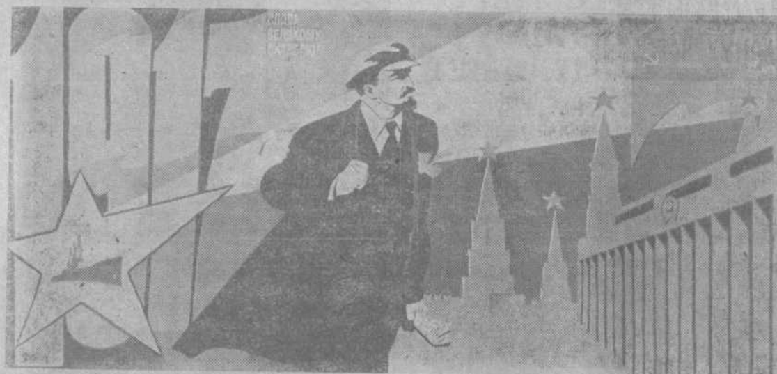
Плакат художника В. Сачкова «Слава Великому Октябрю!».