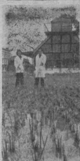
СРВ. Ученые Вьетнама вносят важный вклад в

строительство социализма. Ныне в научных учреждениях республики работают свыше 4 тысяч сотрудников, в том числе почти пятьсот кандидатов и докторов наук. Они проводят исследования в самых различных областях науки: изучают строение недр, животный и растительный мир, работают над темами и языки ядерной физики и астрономии, географии и истории, математики и философии.