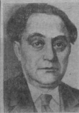
Имя Георгия Михайловича Димитрова (1882—1949) — верного ученика

К. Маркса и В. И. Ленина, видного деятеля международного коммунистического и рабочего движения, учителя и вождя Коммунистической партии Болгарии — окружено ореолом славы и героизма. Человечество никогда не забудет подвиг Димитрова в 1933 году в Лейпциге. Он нанес гитлеровцам, сфабрикованным провокационный процесс против Германской коммунистической партии и Коммунистического Интернационала, первый сокрушительный морально-политический удар.