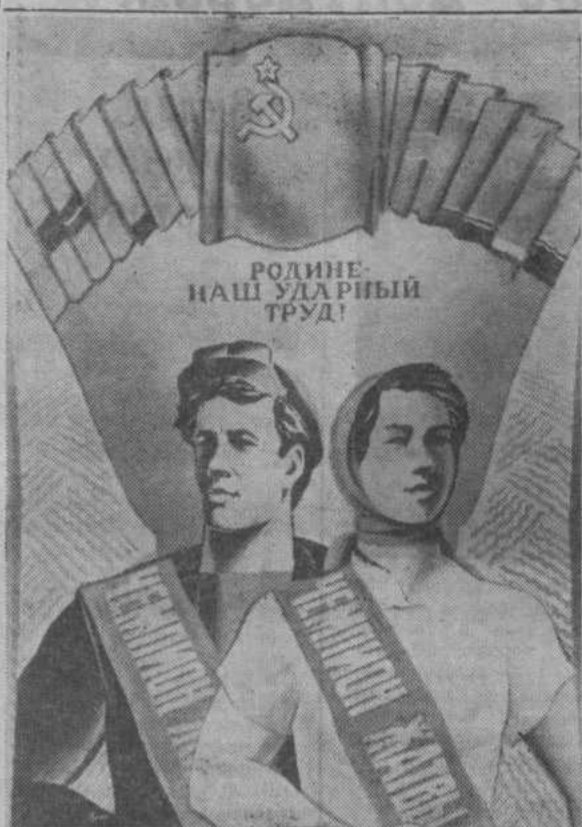
Плакат художника М. Гетмана. Издательство «Плакат».