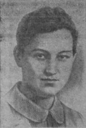
Герой Советского Союза, партизанка Зоя

Космодемьянская во время Великой Отечественной войны совершила подвиг, являющийся примером мужества и высокого патриотизма.