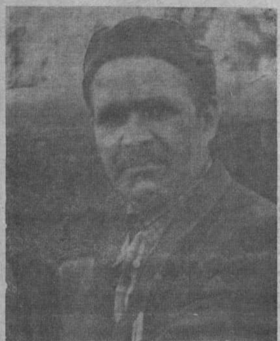
важнейшая задача и ответ на Обращение обкома КПСС к коммунистам, комсомольцам, ко всем трудящимся республики. НА СНИМКЕ: И. И. Каримов.