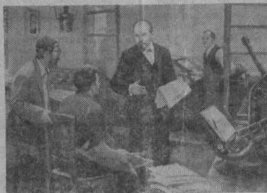
«Искра». Картина художника Д. Налбандяна.