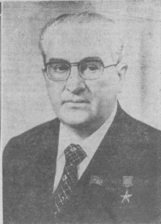
Генеральный секретарь ЦК КПСС, Председатель Президиума Верховного Совета СССР товарищ Юрий Владимирович АНДРОПОВ.