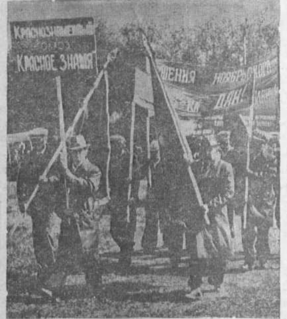
колхоза «Красное знамя»