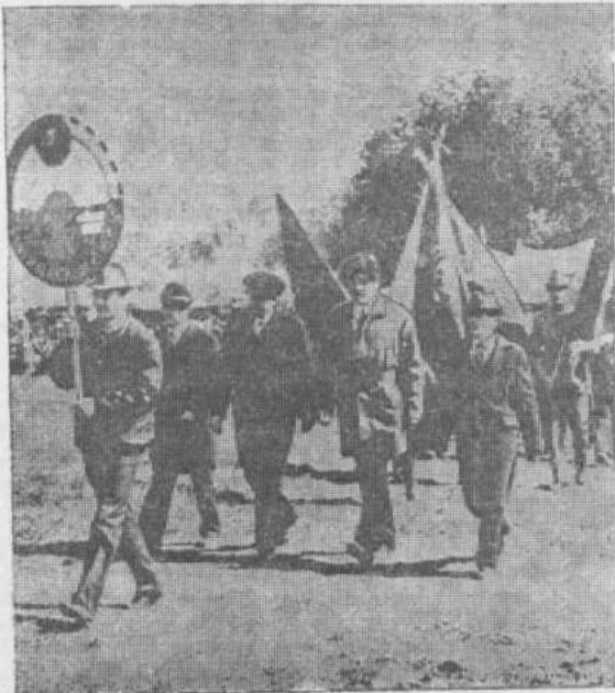
ордена Ленина Матраевского совхоза