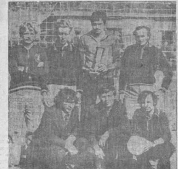
Волейбольная команда колхоза имени Ленина — победительница.