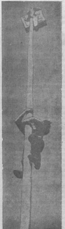
Лазание на шест.

Материалы с районного праздника «Сабантуй» подготовили специальные корреспонденты редакции П. КУЗНЕЦОВ, Р. ИМАНГУЛОВ, У. ИЛИМБЕТОВ, В. УСМАНОВ.