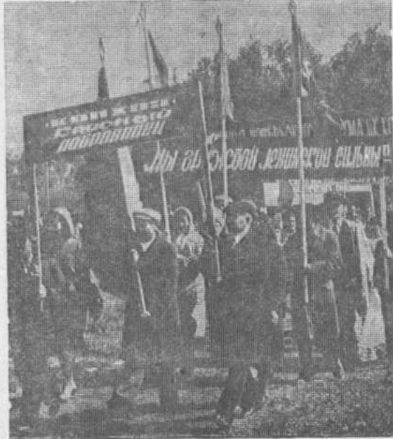
колхоза «Красный доброволец».

на и выпелы передовым коллективам-победителям в социалистическом соревновании на севе-83.