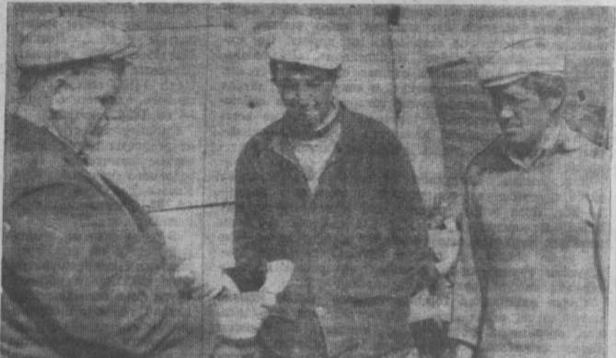
Хорошо трудились на севе зерновых культур механизаторы Центрального отделения Таналянского совхоза. Зерноземель засеяно 2400 гектара.