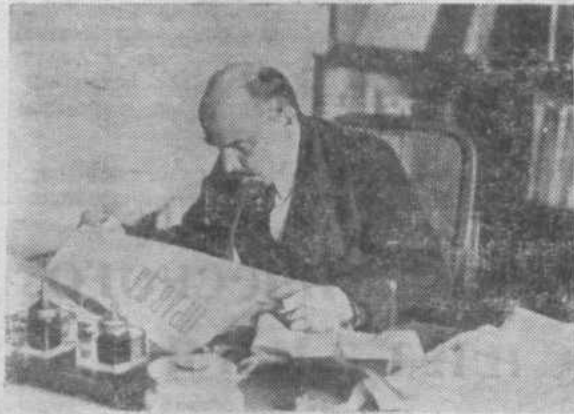
«...Мы должны делать постоянное дело публицистов — писать историю современности...» В. И. ЛЕНИН.