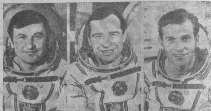
Экипаж космического корабля «Союз Т-8» (слева направо): командир экипажа подполковник Владимир Георгиевич Титов, бортинженер, летчик-космонавт СССР, Герой Советского Союза Гешадий Михайлович Стрекалов и ко-

монавт-исследователь, летчик-космонавт СССР, Герой Советского Союза Александр Александрович Серебров.