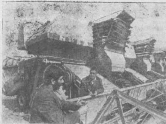
Народно-демократическая партия Афганистана, правительство страны уделяют первостепенное внимание осуществлению глубоких преобразований в сельском хозяйстве — важнейшей отрасли национальной экономики. Большую помощь в этом Афганистану оказывает Советский Союз. При его содействии созданы семь машино-тракторных станций, оснащенных тракторами «Беларусь» и комбайнами «Нива», хорошо зарекомендовавшими себя на полях страны.