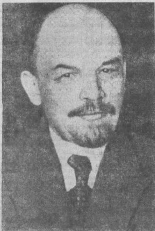
В. И. Ленин.