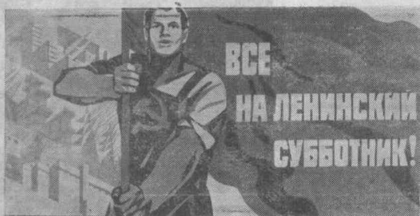
Плакат художника В. Кононова.