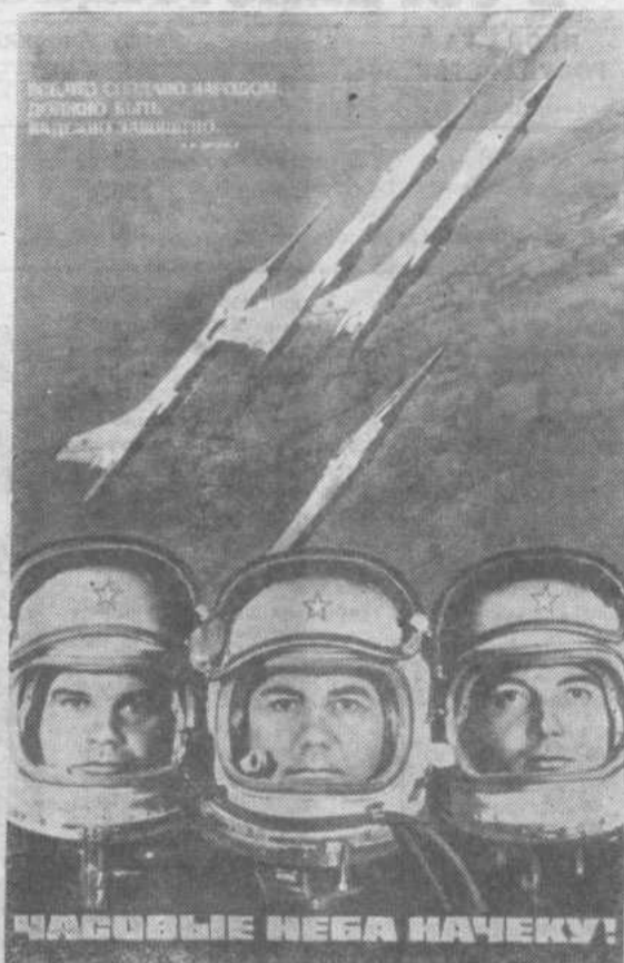
Плакат художника А. Рудакова, Издательство «Плакат».

Воины ПВО, как и весь личный состав Вооруженных Сил, всегда готовы по первому зову партии выполнить свой патриотический и интернациональный долг.