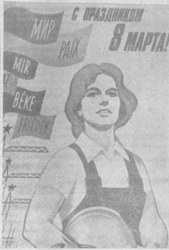
Плакат художника В. Колюкова. Издательство «Плакат».