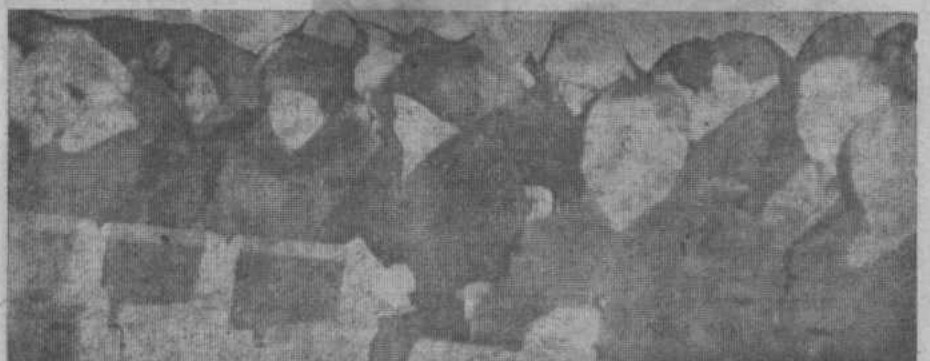
В зале заседаний.