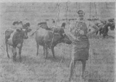
Молдавская ССР. Коллектив республиканского Дома моделей Министерства бытового обслуживания разработал комплекты рабочей одежды для тружеников сельского хозяйства. Выполненные из недорогой хлопчатобумажной ткани костюмы удобны, имеют нарядный вид. Первые партии комплектов по заказам хозяйства выпускаются пошивочными ателье. НА СНИМКЕ: такая одежда предлагается операторам машинного доения.