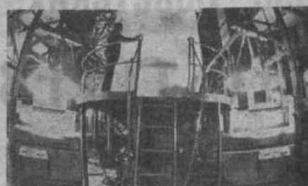
Продолжительная программа СССР нашла горячий отклик у коллектива объединения «Пластик». В объединении производят продукцию для сельского хозяйства — полиэтиленовые пленки, которые идут на устройство теплиц и парников. Заказы земледельцев здесь выполняются в первую очередь и досрочно. Увеличивается производство пленок, отмененных государственным Знаком качества. НА СНИМКЕ: участок изготовления пленки.