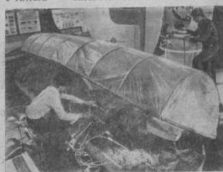
Машин. На базе Всесоюзного научно-исследовательского института сельскохозяйственного машиностроения создано новое научно-производственное объединение ВИСХОМ, призванное быть научно-техническим центром сельскохозяйственного машиностроения.

НПО ВИСХОМ ведет работу по созданию высокопроизводительных современных машин, значительно облегчающих условия труда обслуживающего персонала и высвобождающих немалое количество рабочей силы.