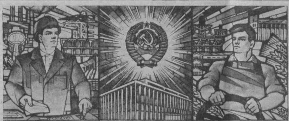
60-летию образования СССР — ударный труд миллионов!

Плакат художника А. Кебы, Издательство «Плакат».