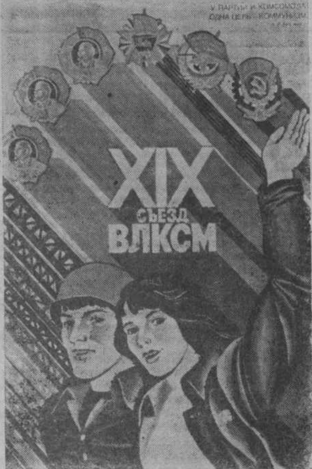
Плакат художника Л. Непомнящего. Издательство «Плакат».