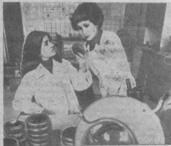
В городе Чаренцаване, на головном предприятии Армянского производственного объединения «Лизин», начато массовое изготовление кормового лизина.