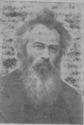
Иван Иванович Шишкин (1832—1898)—один из самых

крупных и самобытных художников, с его именем связан расцвет русского реалистического искусства второй половины XIX века.