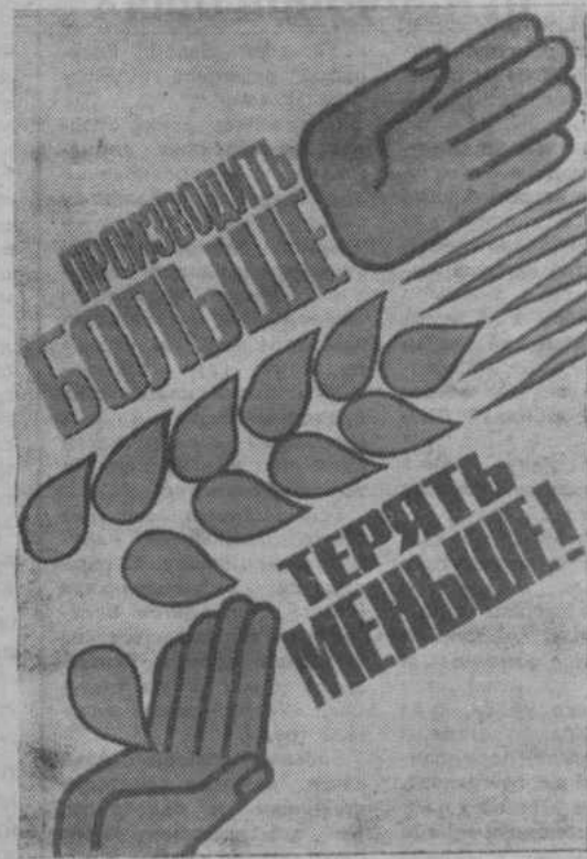
Плакат художников Л. Бельского и В. Потапова. Издательство «Плакат».

На базе своевременного ввода в действие пусковых объектов, снижения объемов незавершенного строительства, сокращения сроков в стоимости строительных работ годовой план завершим 25 декабря.