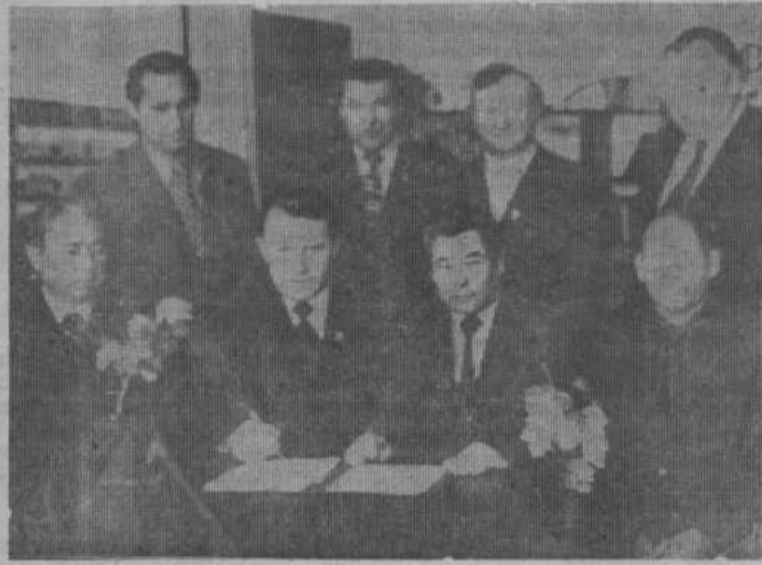
НА СНИМКАХ: делегации нашего и соревнующихся районов (на левом снимке баймаковцы, на правом — гайчане) подписывают договора на трудовое состязание в 1982 году.