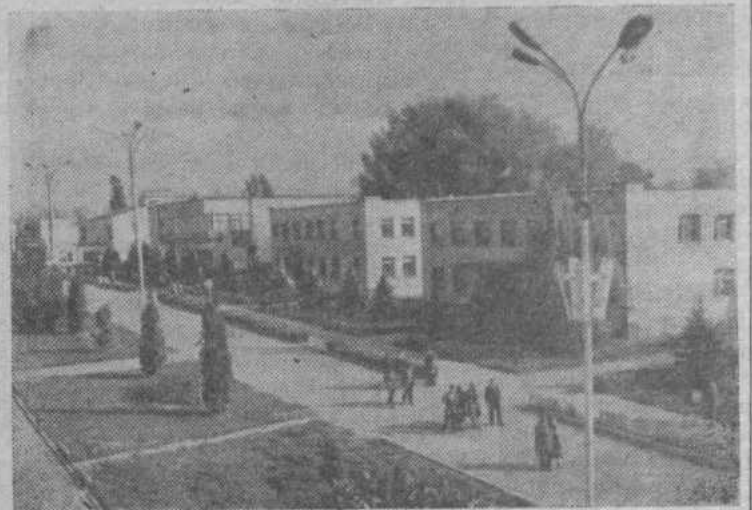
КРАСНОДАРСКИЙ КРАЙ. Орденом Трудового Красного Знамени за успехи, достигнутые в десятой пятилетке в производстве и продаже государству продуктов земледелия и животноводства, награжден колхозом коммунистического труда «Победа» Каневского района.