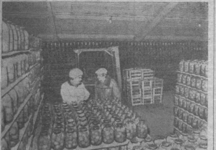
НА СНИМКАХ: одна из улиц станции Каневской — центральной усадьбы колхоза «Победа»; ангар для техники в 6-й бригаде колхоза.

Молодежь привлекают хорошие условия труда и быта и после окончания средней школы она остается работать на земле отцов. Многие продолжают учебу на заочных отделениях институтов и техникумов. Сейчас на различных участках колхозного производства трудятся почти двести специалистов с высшим и средним образованием.