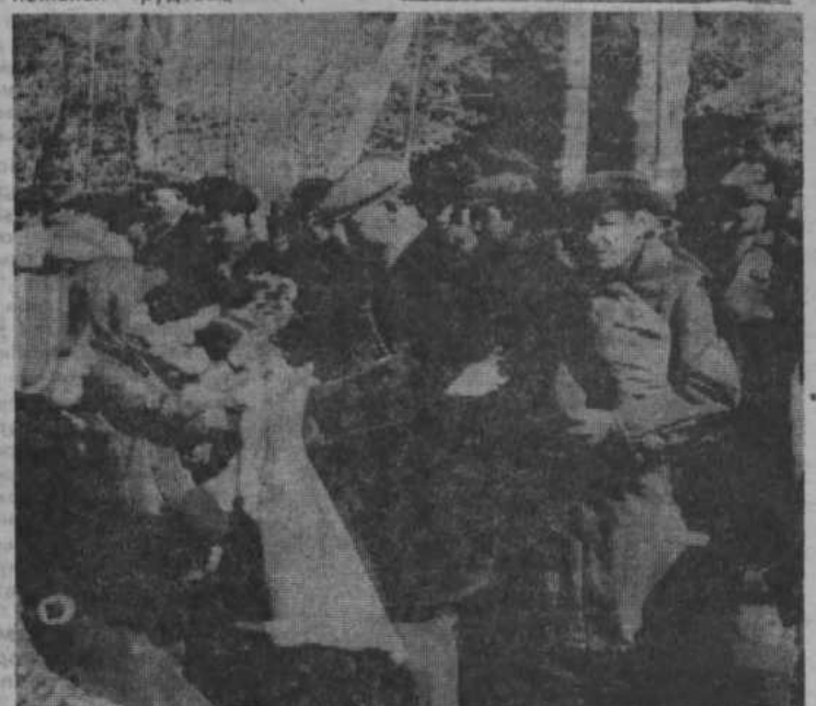
НА СНИМКАХ: поднятие флага; встреча пионеров с хлеборобами.

В НЫНЕШНЕМ ГОДУ коллектив совхоза принял высокие социалистические обязательства и с честью сдержал свое хлеборобское слово. С площади 15600 гектаров получено по 22,6 центнера зерновых, валовое производство составило 339363 центнера, из которых в закрома Родины отправлено 236000 центнеров. Такого количества хлеба за все годы своего существования совхоз еще не сдавал. Засыпаны семена, продовольственные фонды и фураж. Труженики совхоза в год двадцатипятилетия освоения целинных земель приложили мак-