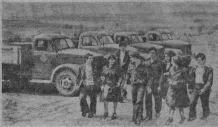
Молдавская ССР. В поселке Светлый Чадыр-Лунгского района создана база, которая будет готовить для сельского хозяйства республики специалистов среднего звена.

Теперь дети местных земледельцев после окончания десятилетки могут учиться в Светловском совхозе-техникуме защиты растений. Государство предоставило в их распоряжение мощную производственную базу, просторные корпуса учебных зданий. Аудитории, лаборатории, кабинеты и классы оснащены новейшей аппаратурой и техническими средствами.