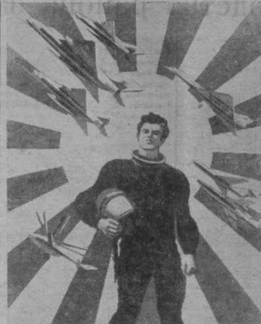
НАМ КРЫЛЬЯ РОДИНА ДАЛА НА ПОДВИГ И НА ТРУД!

Всенародный праздник — День Воздушного Флота СССР — боевой смотр достижений отечественной авиации, успехов советских летчиков, штурманов и авиаспециалистов, ученых и кон-