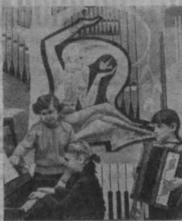
Семьдесят детей целинников

занимаются в Адамовской районной детской музыкальной школе.