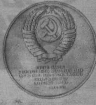
Насильная памятная медаль, учрежденная в ознаменование 25-летия с начала освоения целинных и залежных земель.