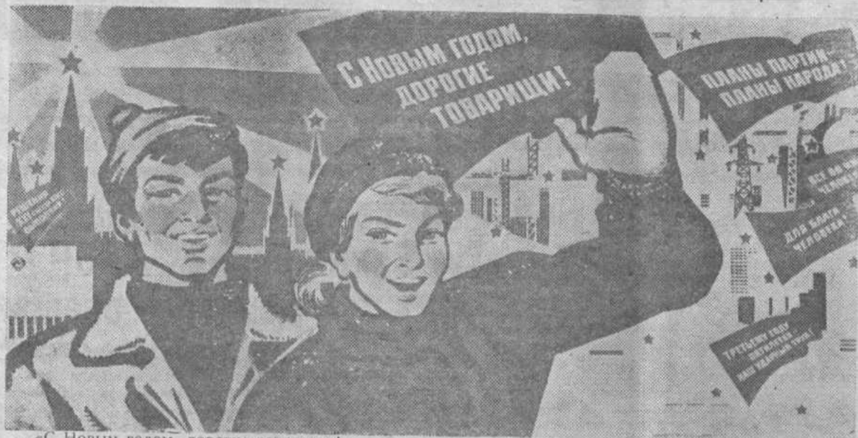
«С Новым годом, дорогие товарищи!». Плакат художника В. Сачкова. Издательство «Плакат».