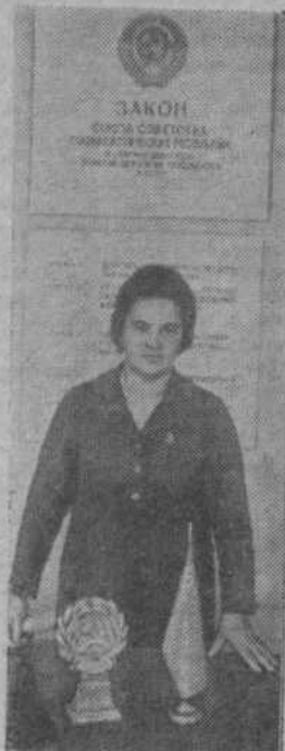
«Вся власть в СССР принадлежит народу. Народ осуществляет государственную власть через Советы народ-

ных депутатов, составляющие политическую основу СССР».