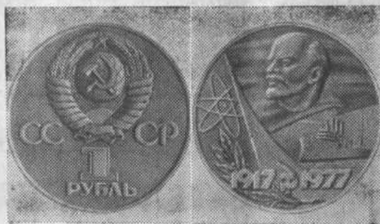
Юбилейная монета достоинством в 1 рубль, выпускаемая в обращение 1 ноября 1977 года в ознаменование 60-летия Великой Октябрьской социалистической революции.