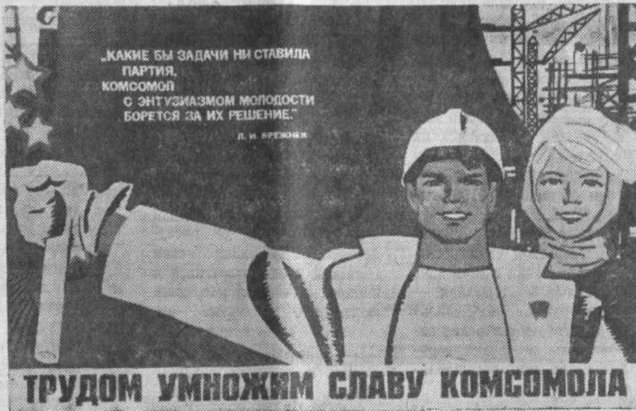
Плакат художника И. Коминарца. Издательство «Плакат».