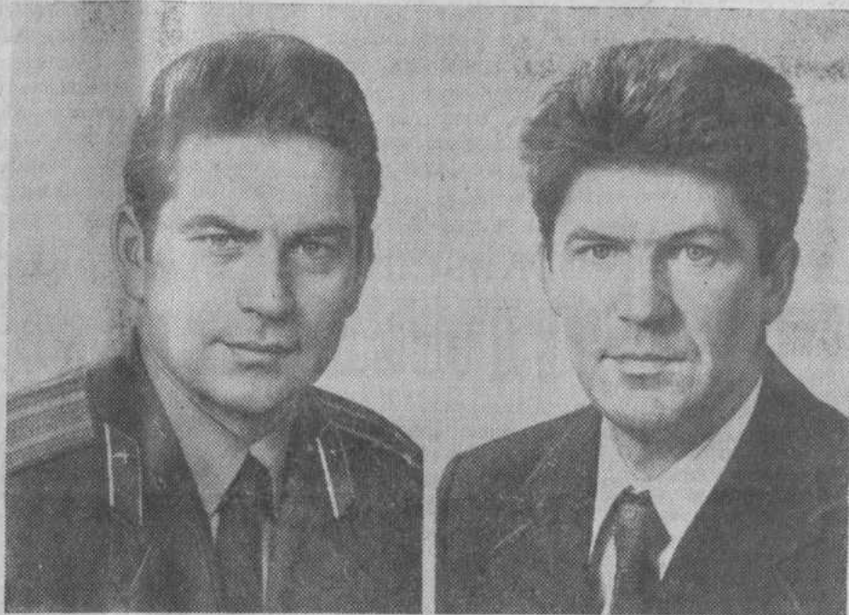
Коваленок Владимир Васильевич — командир космического корабля «Союз-25». Рюмин Валерий Викторович — бортинженер космического корабля «Союз-25».

Из-за отклонений от предусмотренного режима причаливания стыковка была отменена. Экипаж благополучно возвратился на Землю. Орбитальная научная станция «Салют-6» продолжает полет.