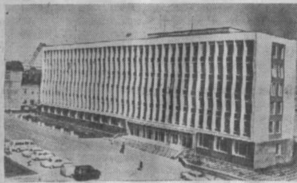
Саранск. Новое здание Дома Советов.