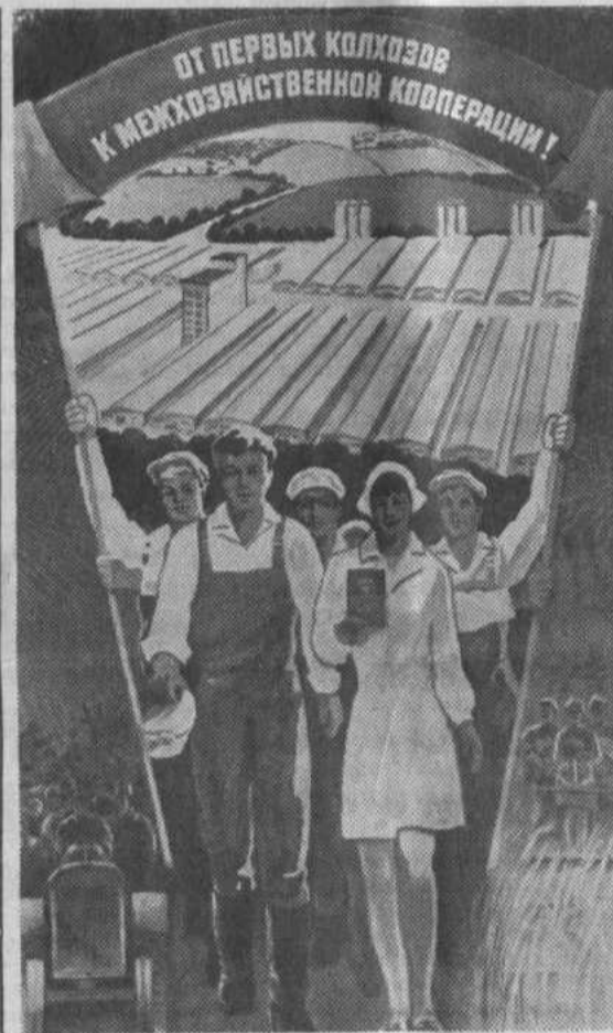
Плакат художника В. Удоде. Издательство «Плакат».

Сравнительно неплохой урожай в условиях засухи собрали земледельцы колхоза имени Ленина — по 11,1 центнера, имени Салавата — по 10,8 центнера с гектара зерновых. Ордена Ленина