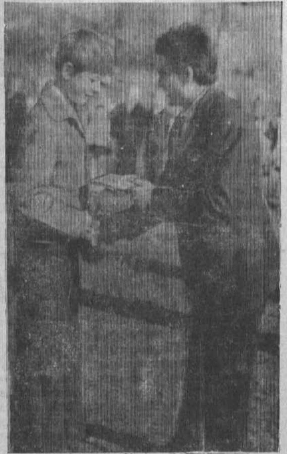
учебного года, были вручены ценные подарки. Все это говорит о том, что трудовое воспитание в данной школе стоит на правильном пути.

Хорошо трудились учащиеся и этим летом на полях, животноводческих фермах совхоза. 9-й наиболее отличившимся учащимся на торжественной линейке, посвященной началу нового