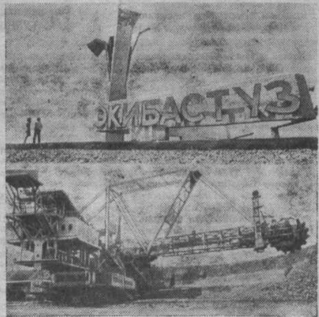
Казахская ССР. Объединение «Экибастузуголь» — одно из крупнейших в Советском Союзе. Добыча самого дешевого в стране топлива здесь ведется открытым способом с помощью мощной современной

*В системе здравоохранения в республике работают свыше 40 тысяч врачей.