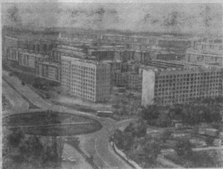
Столица Казахской ССР — Алма-Ата. Новый микрорайон «Орбита».

Трудящиеся республики одобряют проект новой Конституции СССР. Они полны решимости новыми трудовыми успехами встретить 60-летие со дня основания первого в мире социалистического государства, успешно претворить в жизнь исторические решения XXV съезда КПСС.