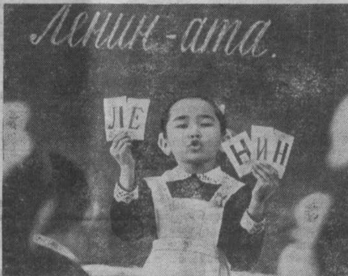
До установления Советской власти на территории Казахстана число грамотных среди коренного населения не превышало двух процентов.

Великий Октябрь принес казахскому народу все блага культуры.