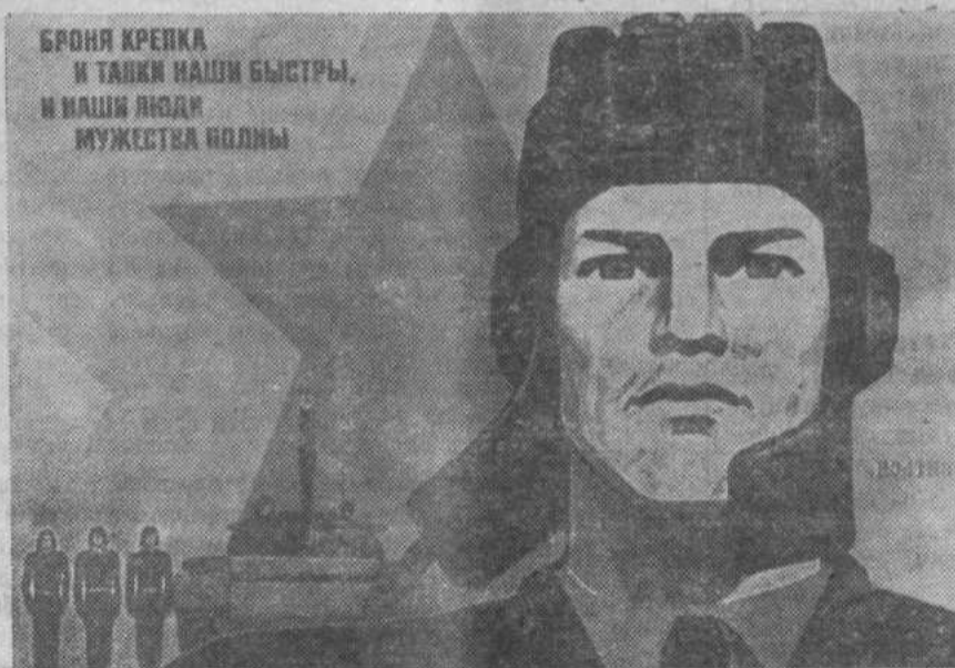
Плакат художника И. Коминарца к Дню танкистов. Издательство «Плакат».