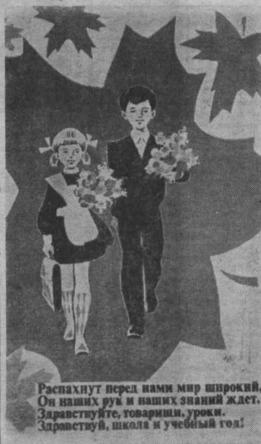
Плакат художника В. Сачкова. Издательство «Плакат».

* Теперь свыше трех четвертей работников, занятых в народном хозяйстве, имеют высшее или среднее (полное или неполное) образование, тогда как в дореволюционной России почти три четверти взрослого населения было неграмотным.