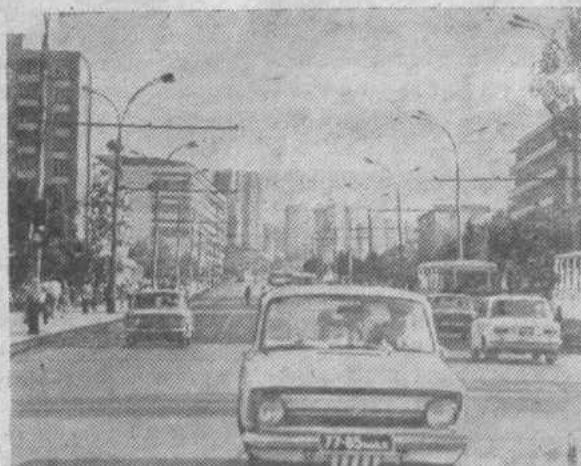
Столица Молдавской ССР — Кишинев. НА СНИМКЕ: улица Тимошенко, связывающая старую часть города с новыми микрорайонами.

* Различными видами обучения в республике охвачено 1,5 миллиона человек.