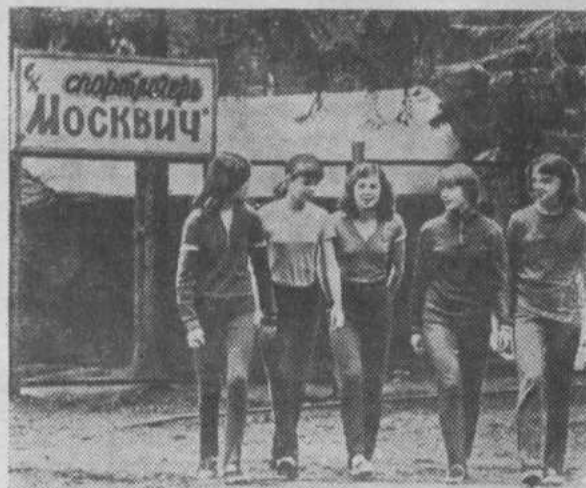
Спортлагерь «Москвич» находится в живописном месте Подмосквья. Небольшой палаточный городок окружен лесом. 220 ребят совершенствуют

здесь свое спортивное мастерство. Футбольное поле, рекортановая дорожка для легкоатлетов, спортивный инвентарь — все в распоряжении детей. Но особой их гордостью является 25-метровый плавательный бассейн.