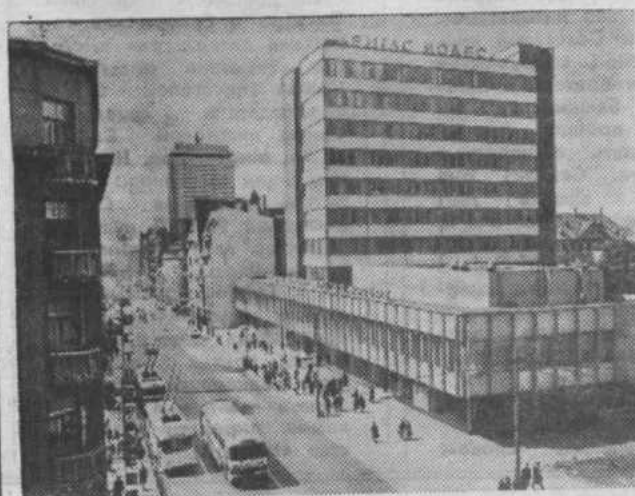
Латвийская ССР. Рига. Улица В. И. Ленина.

* За год только по путевкам на Рижском взморье лечатся и отдыхают 300 тысяч трудящихся. 100 миллионов рублей отпущено на дальнейшее развитие города-курорта Юрмалы в десятой пятилетке.