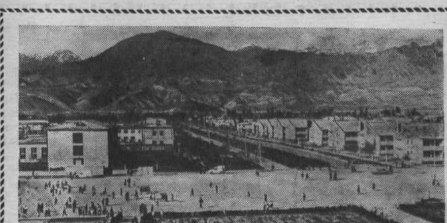
Киргизская ССР. Поселок Токтогул — районный центр, Ошской области.

Х. ХАЙДАРОВ, зав. орготделом райкома ВЛКСМ.