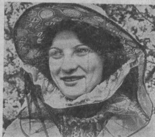
Ростовская область. Азовского района — крупное агропромышлен-