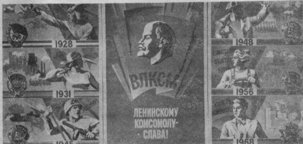
Плакат художника В. Бельтюкова. Издательство «Плакат», (Фотохроника ТАСС).