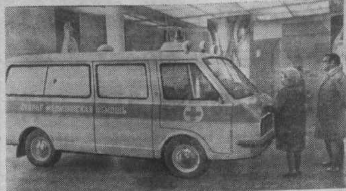
МОСКВА. В павильоне «Здравоохранение» на ВДНХ СССР открыта выставка, посвященная перспективам развития советского здравоохранения на 1976—1980 гг.

НА СНИМКЕ: новая машина скорой медицинской помощи РАФ-22031 «Латвия», разработанная и изготовленная заводом микроавтобусов РАФ имени XXV съезда КПСС. Она предназначена для оказания медицинской помощи больному в салоне автомобиля как на стоянке, так и в пути следования. Машина осуществляет доставку медицинского персонала, лечебных средств и необходимой медицинской аппаратуры. Предусмотрено оказание помощи одновременно двум человекам. Машина отличается мягкой подвеской, высокой маневренностью и динамичностью на любых дорогах.