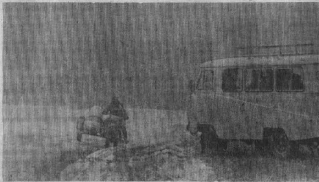
Первый снег в акъюловских лесах.

О. ПЕСТОВА, зав. подготовительным отделением Башгосуниверситета.